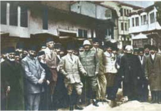
İstanbul Hükümeti'nin temsilcisi Bahriye Nazırı (Bakani) Salih Hulusi (Kezrak) Paşa'yla görüşmek üzere Amasya'ya giderken Tokat'ta karşılaşması (17 Ekim 1919)

ler araştırmakta... Hükümet aciz, haysiyetsiz ve korkak... Ordunun elinden silahları, cephanesi alınmış ve alınmakta... İtilaf devletleri, ateşkes anlaşmasının hükümlerine uymayı gerekli bulmuyorlar... Bundan başka memleketin her tarafında Hıristiyan azınlıklar gizli veya açıktan açığa kendi özel emel ve maksatlarını gerçekleştirmeye, devleti bir an önce çökertmeye çalışıyorlar... Durumun dehşet ve korkunçluğu karşısında her yerde, her bölgede birtakım kimseler tarafından kurtuluş çareleri düşünölmeye başlanmıştı... Memleket içinde ve İstanbul'da milli varlığa düşman kuruluşlar; Kürt Teali Cemiyeti, Teali-i İslam Cemiyeti, İtilaf ve Hürriyet Cemiyetleri, Sulh ve Selamet Cemiyetleri... İngiliz Muhipleri Cemiyeti, Amerikan mandası isteyenler... .. Millet ve ordu, padişah ve halifenin hainliğinden haberdar olmadığı gibi, o makama ve makamda bulunana karşı, asırların kökleştirdiği din ve gelenek bağları dolayısıyla da, içten gelerek, boyun eğmekte ve sadık. .... Halifesiz ve padişahsız kurtuluşun anlamını kavrama yeteneğinde değil. Bu inanca aykırı bir düşünce ve görüş ileri süreceklerin vay haline! Derhal dinsiz, vatanısız, hain ve istenmeyen kişi olur... Kurtuluş çaresi ararken