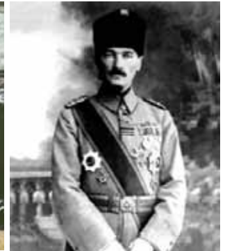
Mustafa Kemal Ordu Komutanı ve Padişah Yaveri iken çekilen fotoğrafı, İstanbul (31 Ekim-13 Kasım 1918)