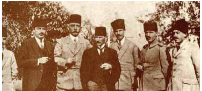
Mustafa Kemal kongre üyeleriyle (1919)