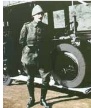
Çanakkale Savaşları'nda Kurmay Albay Mustafa Kemal (1915)