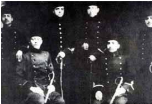
Mustafa Kemal (oturanlardan sol baştaki) Manastır Askeri İdadisi'nde bir grup arkadaşıyla (1898)

Avrupa devletleri kendi aralarında da gruplaşmış, çok büyük bir mücadele içindeydiler. Çanlar çalılıyordu. Küçük bir kıvılcım savaşın başlaması için yeterliydi. Nitekim öyle oldu. Bir suikast, savaşı başlatmaya yetti.