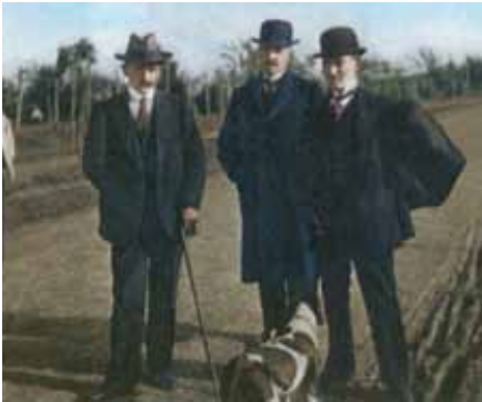
Mustafa Kemal Sofya'da ateşemiliterken (1914)