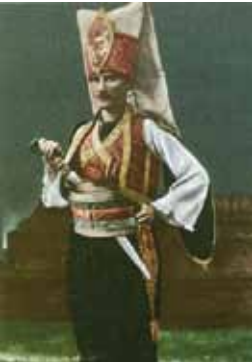
Mustafa Kemal Sofya'da ateşeyken yeniçeri kıyafetiyle katıldığı kostümlü baloda (1914)

Mustafa Kemal Paşa, cuma selamlığından sonra kendisini kabul eden Padişah Vahdettin'le mütarekeyle ortaya çıkan siyasi durumu görüştü.