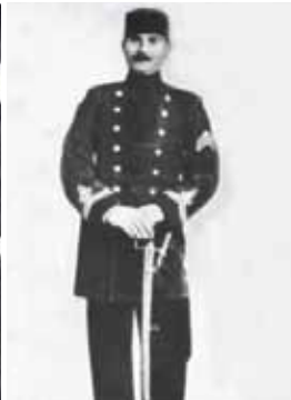
Harp Okulu öğrencisi Mustafa Kemal (13 Mart 1899)