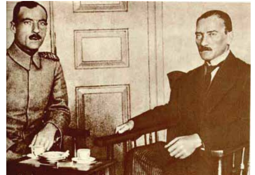
Mustafa Kemal, zamanın Tümen Komutanı Çahit Toydemir ile görüşürken (1919)