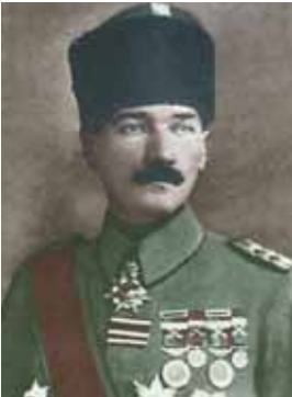
Mustafa Kemal, Yıldırım Orduları Grup Komutanı iken (31 Ekim - 13 Kasım 1918)