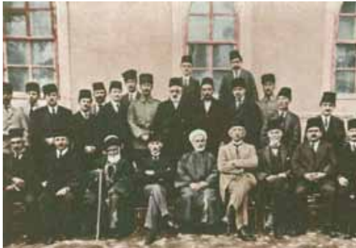
Mustafa Kemal, Sivas Kongresi üyeleri ile (Eylül 1919)