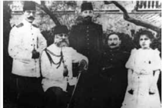
Mustafa Kemal Trablusgarp'ta, Sancak Kumandanı İbrahim Paşa ile birlikte (26 Eylül 1908)